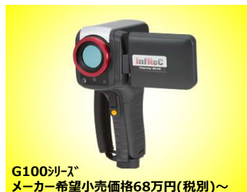
G100シリーズ メーカー希望小売価格68万円(税別)～