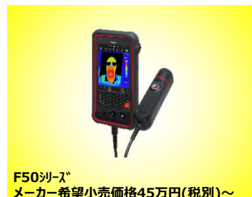
F50シリーズ メーカー希望小売価格45万円(税別)～

※Avioのサーモグラフィなら、体表温スクリーニングの他に 電気設備などの診断 や、熱にかかわる 研究開発 にも ご利用いただけます。