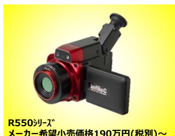
R550シリーズ メーカー希望小売価格190万円(税別)～