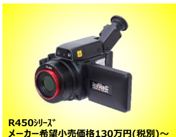
R450シリーズ メーカー希望小売価格130万円(税別)～